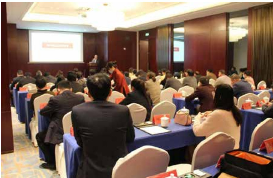
上海中期助力乡村振兴湖南永州行 - 生猪专题培训系列会议

“期货”的参与使得传统“保险”的广度与深度大大扩展。打通农户与期权市场之间的阻隔，无疑将向整个农业保险领域注入巨大的活力。保障标的市场化与产品结构的创新性使得“保险+期货”在政策配套、产品开发以及市场推广等方面拥有无可比拟的优势。